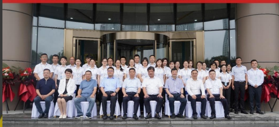
国科检测技术服务(山东)有限公司开业仪式

山东中科检测的成立,是中国科学院控股有限公司与济南市深度合作的又一典范,是广州化学“强协同 深融合 防风险 重实效”战略举措的成功实践,实现了检验检测业务板块在京津冀地区、环渤海经济区的战略覆盖。山东中科检测已完成3000余平米检验检测实验室的建设并取得CMA资质,围绕环渤海城市群产业特点,大力发展广州化学成果转化北方中心,积极布局化工反应安全评估实验室、海洋生态监测实验室、黄河流域生态监测实验室、双碳联合实验室,全面建设成集检验检测、科技研发、技术转移转化的示范机构。